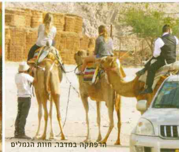
הרפתקה במדבר. חוות הגמלים

טיפ אילת יקרה? חפשו קופונים, מבצעים והנחות באתר תאגיד התיירות, redseaeilat.co.il/eilat-vacation/specials/ וגם במוספים שונים המחולקים חינם בבתי המלון ובמרכזי התיירות (למשל: "אילת Wellcome" או "בטן גב").