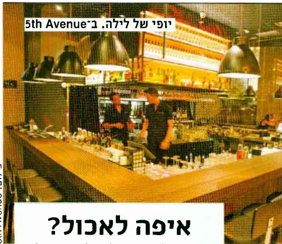
יופי של לילה. ב־5th Avenue