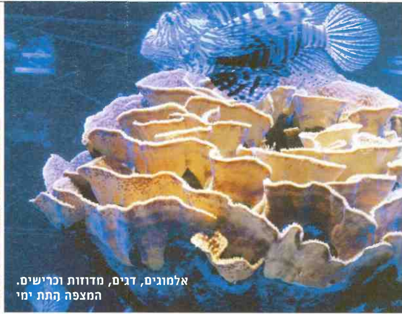
אלמוגים, דגים, מדוזות וכרישים. המצפה התת ימי