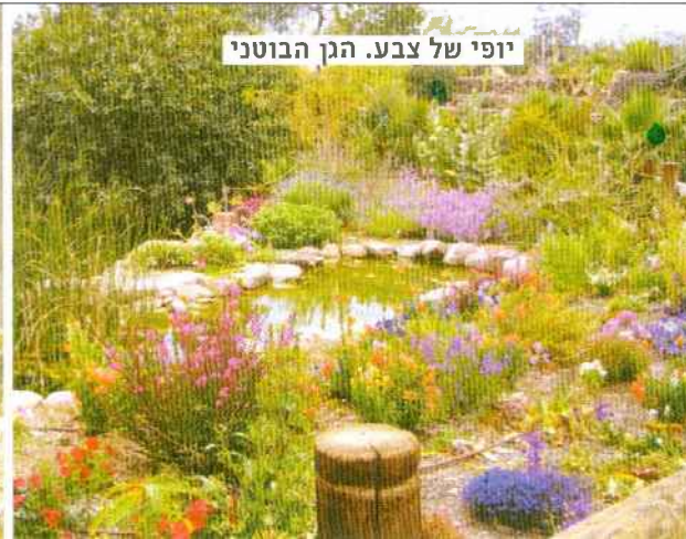
יופי של צבע. הגן הבוטני

טיפ נוסעים במכונית? אל תשכחו לתדלק לפני שאתם יוצאים לדרך צפונה. הנחת היעדר המע"מ חלה גם על מחיר הדלק.