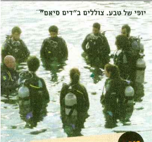
יופי של טבע. צוללים ב"דים סיאם"