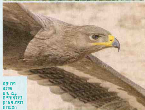
פרויקט שזכה בפרסים בינלאומיים רבים. פארק הצפרות