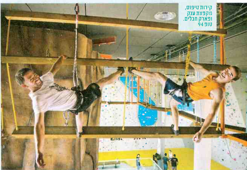
קירות טיפוס, מקפצת ענק ופארק חבלים. טופ 94