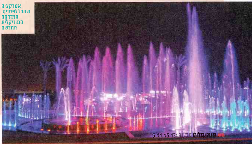
אטרקציה שחבל לפספס. המזרקה המוזיקלית החדשה

כתובת: הפארק המרכזי אילת (מול קניון מול הים).