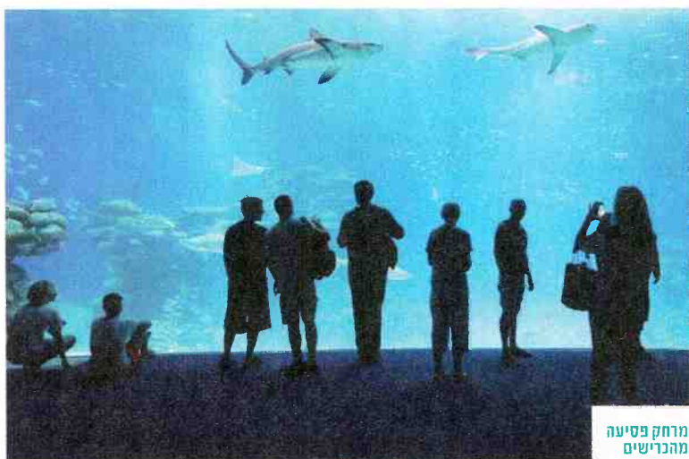
מרחק פסיעה מהכרישים שחגים מעל מפְרץ הכרישים

ה מצפה התת ימי באילת פתח בימים אלה את מפְרץ הכרישים , מתחם עצום המשתרע על שטח של 1,000 מ"ר, הכולל מרכז מבקרים אינטראקטיבי ובו בריכת אקווריום ענקית - הגדולה במזרח התיכון - ביתם של לא פחות מ־16 כרישים, שמגיעים עד לגודל של ארבעה מטרים. את הבריכה חוצה מנהרה אקרילית שקופה שהמבקרים העוברים דרכה יכולים לראות במרחק פסיעה את הכרישים החגים מעל ולזכות בהסבר על עולמם, כולל האכלה בלייב על ידי צוללן אמיץ. המרכז כולל גם מיצגים