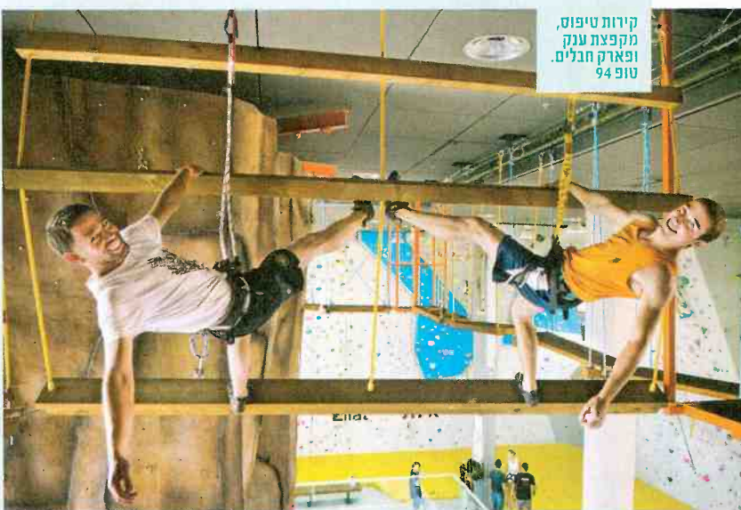
קירות טיפוס, מקפצת ענק ופארק חבלים. טופ 94