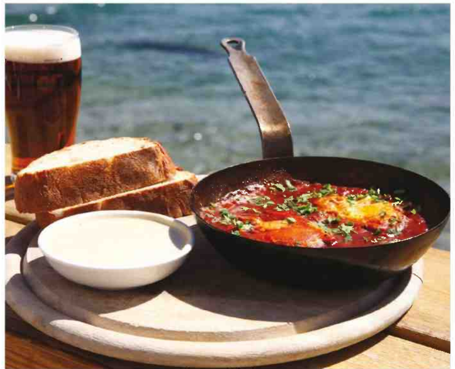
ארוחת בוקר בבר ביץ'. נמצא בחוף אלמוג, הסמוך לשמורת האלמוגים

קיף לנוף של טבע וים. החל מהשעה שבע בערב הבר נפתח לקהל הרחב ויש בו הופעות ואוכל טוב, מול אחד הנופים היפים בארץ.