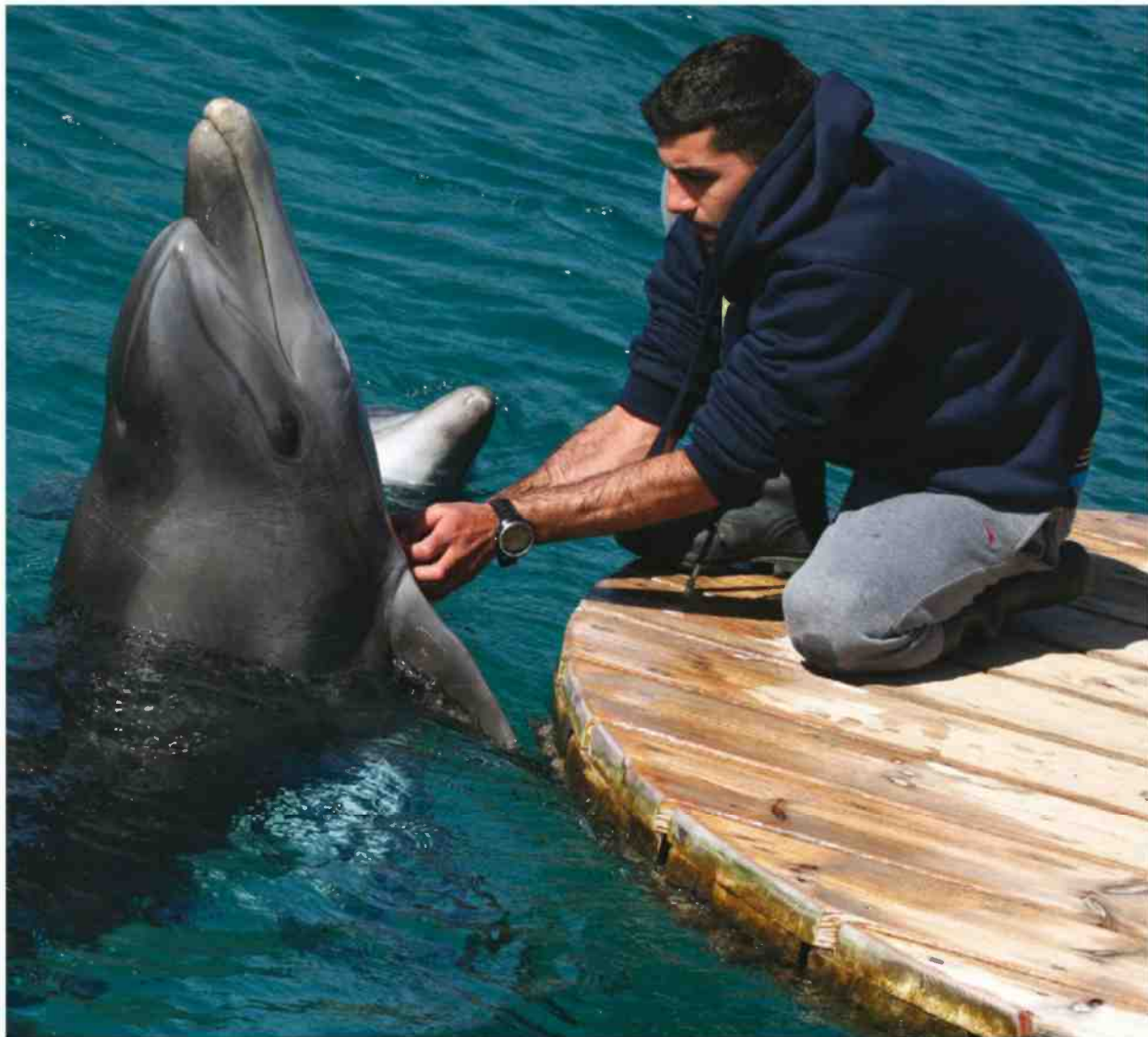
ריף הדולפינים. ארבע נקבות ושני זכרים

ויקרה. בכלל, בסוף השבוע הזה (עד 14 במאי רס) יתקיים בעיר סוף שבוע קולינרי הכולל בין השאר טעימות, ביקורים ביקבים, סדנאות ומפגשים עם שפים. או יאללה, למה אתם מחכים? אילת מחכה לכם!