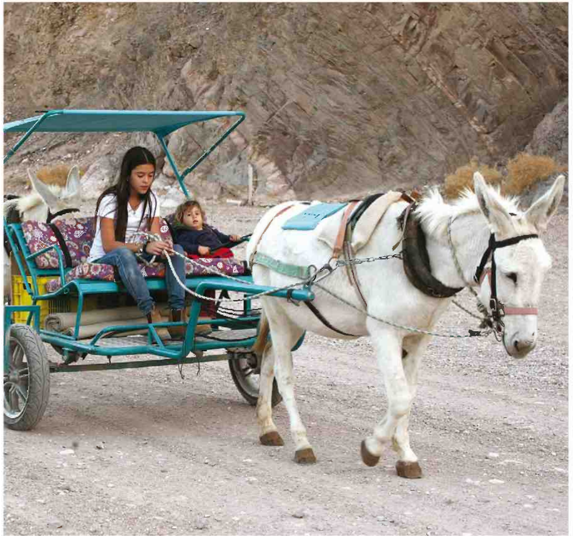
טיול בכרכרה בחוות הגמלים. אפשר להיכנס לחווה ללא תשלום