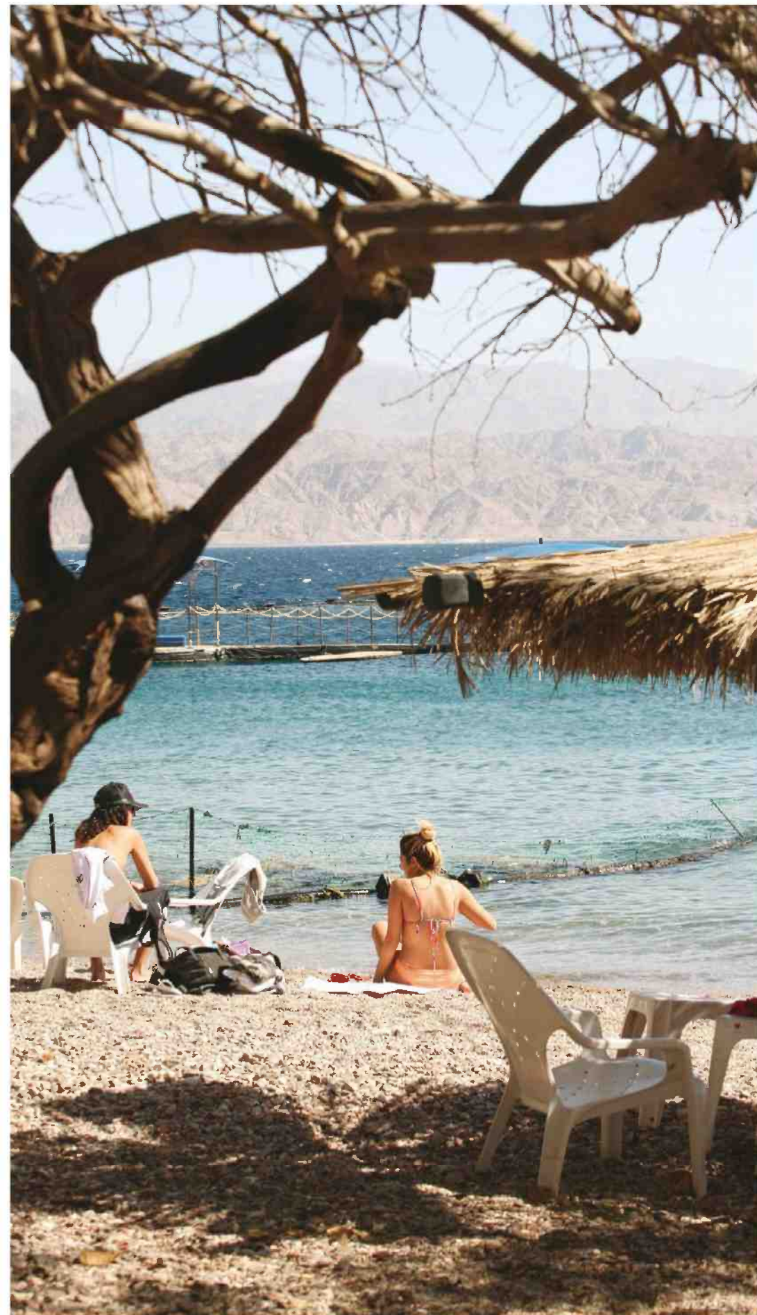
החוף של ריף הדולפינים. מזכיר את החופים במזרח הרחוק

גם רוי, שמאחוריו כבר 15 אלף צניחות, אומר שהוא מתקשה לא להתפעל מהחוויה בכל פעם מחדש. לפני הצניחה סיפר לי שהמטוס שבו טסנו היה שייך למשפחת המלוכה הירדנית, שלצונחים