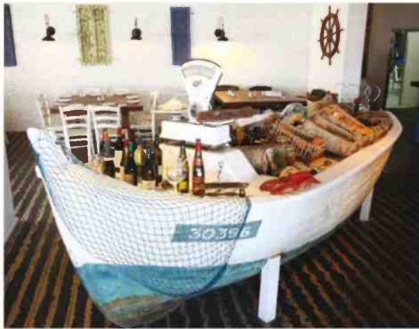
מסעדת שוק דגים. במרכז המסעדה אוניית דייגים עתיקה